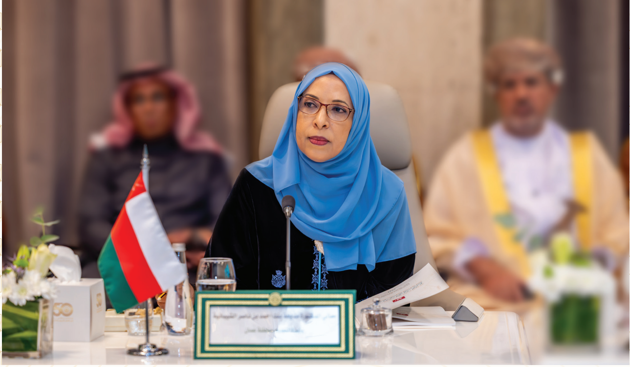
معالي د. مديحة بنت أحمد الشيبانية: وزيرة التعليم في سلطنة عمان: