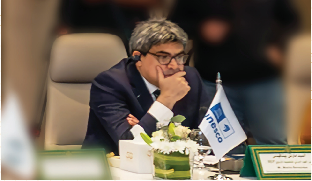
السيد دكتور مارتن بينا فيدس مدير المعهد الدولي للتخطيط: